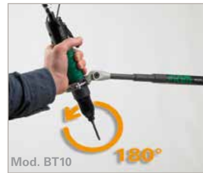
NUMEROSI ACCESSORI PER MIGLIORARE L'ERGONOMIA DEL POSTO DI LAVORO.

ECO-CONTRIBUTO RAEE ASSOLTO: per gli accessori elettronici, Fiam adempie ai suoi oneri di produttore, nel pieno rispetto dell'ambiente, e senza alcun sovrapprezzo per il cliente