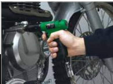
Avvitatore a pistola avanzata