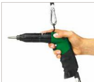
IMPUGNATURA A PISTOLA.

Impugnatura a pistola avanzata: indicata dove non è possibile utilizzare sistemi di sospensione e ove non sono necessarie particolari spinte lungo l'asse di avvitatura