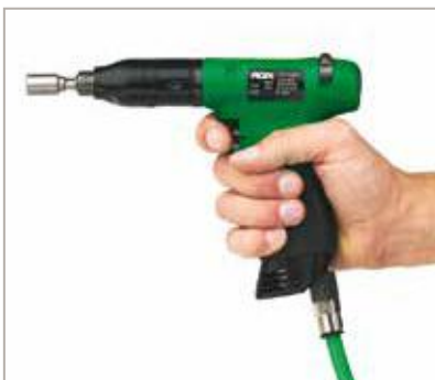
IMPUGNATURA A PISTOLA AVANZATA.

Dotati di dispositivo di sospensione: per l'aggancio a bilanciatori, affinché ogni sforzo nel sostenere l'utensile sia annullato