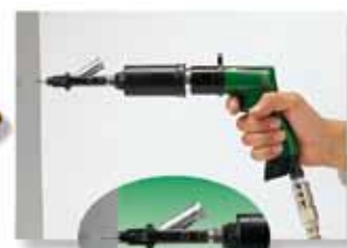
Posizionamento della vite in zona avvitatura