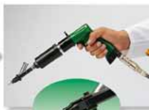
La vite è caricata