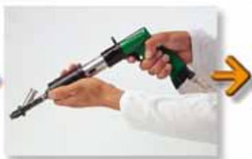
Caricamento semiautomatico (manuale) della vite sulla testa dell'avvitatore