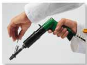
Caricamento manuale della vite