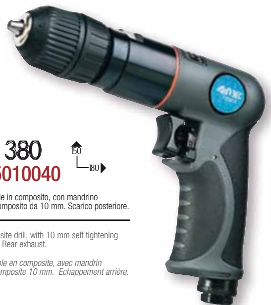
Mod. 380 Cod. 15010040

Perceuse compacte avec mandrin autoserrant en composite 6,3 mm. Echappement arrière.