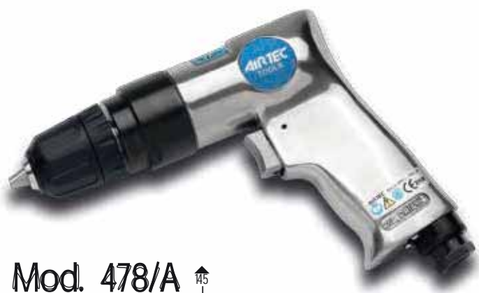
Mod. 478/A Cod. 15010010