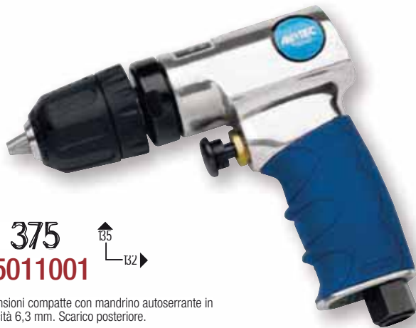
Mod. 375 Cod. 15011001

Trapano di dimensioni compatte con mandrino autoserrante in composito capacità 6,3 mm. Scarico posteriore.