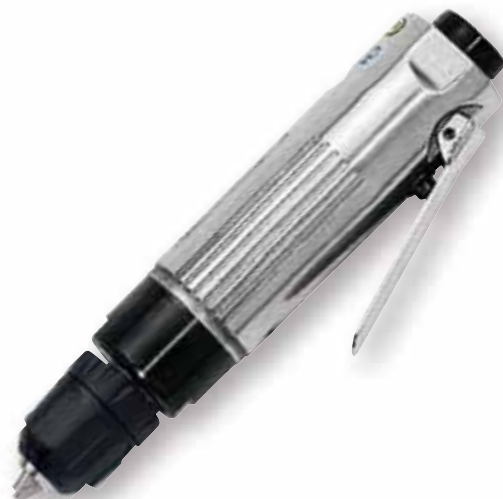
Mod. 495/A Cod. 13200040

Perceuse avec mandrin autoserrant en composite. Echappement arrière.