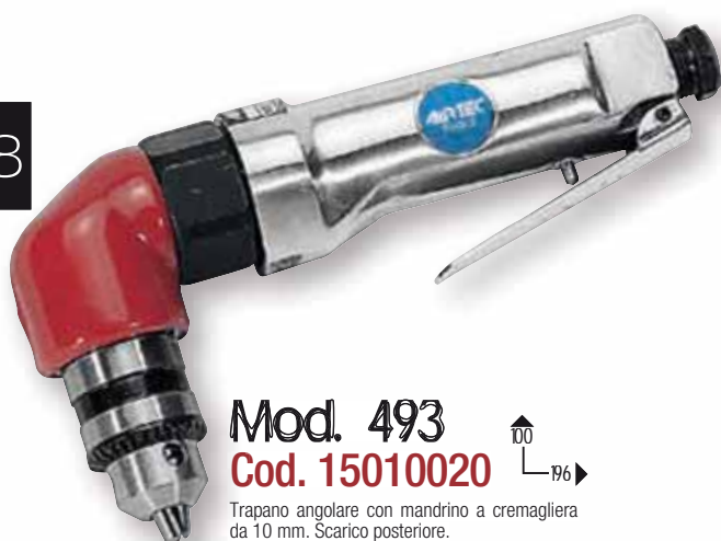
Mod. 493 Cod. 15010020