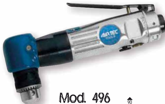
Mod. 496 Cod. 15010021

Perceuse à renvoi d'angle avec mandrin à clé 10 mm. Echappement arrière.